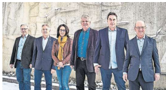
FDP-Kandidaten: Stellen sich für die Gemeinderatswahlen 2021 zur Verfügung.